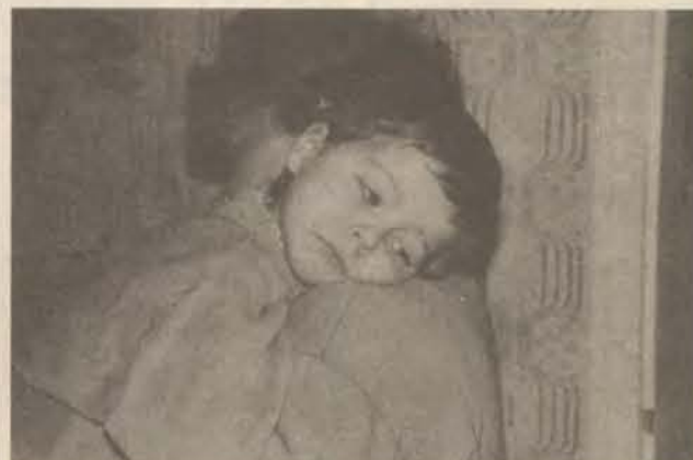
Felvételünk három nappal az indulás előtt készült.