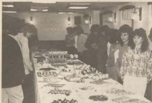
Felvételünk közvetlenül a megnyitó után készült

A kereskedelmi és vendéglátóipari iskola szakács és cukrász-tanulóit az általuk készített termékkülönlegességekből rendeztek kiállítását az izléselesen felszerelt klubhelyiségükben. A csodálatos készítményekkel megrakott hosszú asztalostól valamennyi osztály megtekintette és – néhány szakmabelivel együtt – elismerően nyilatkoztak. A kiállított termékeket a helyszínen meg lehetett vásárolni. Hasonló akciókat az iskola a közeljövőben is tervez, a diákok nagy örömeire.