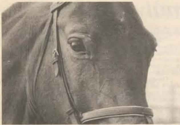
Reméljük nem hiába ugrálnak...