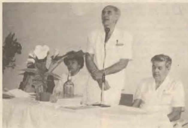
A vezetés a pártatlanság fehér színében