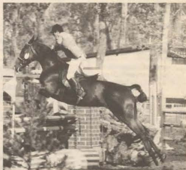
Összeállításunk a harmadik oldalon.