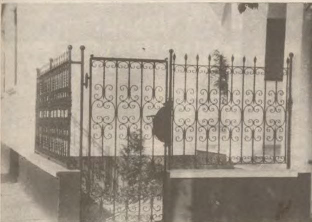
A védelem a ház díszje is lehet!