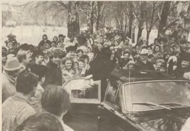
Tömeg fogadta Isaurát.

szinte megbénította a közlekedést. Így aztán más lehetőség híján Isaura egy helikopterrel érkezett. A fogadására egybegyűlt tömeg lelkesen üdvözölte, a szerencsésebbek autogramhoz is jutottak. A Városi Tanács dísztermében lezajlott rövid fogadás után a „rabszolgány” meglátogatta a Skála TEXCOOP akkor még virágzó gyárát, majd a Csipkeházban megcsodálta a város hírnevét