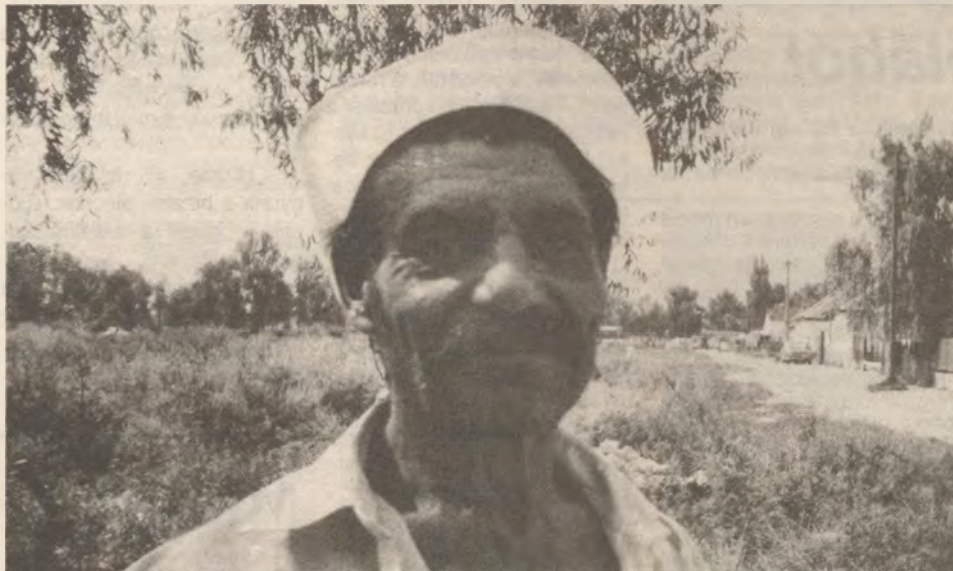
Cikkünk a második oldalon olvasható.