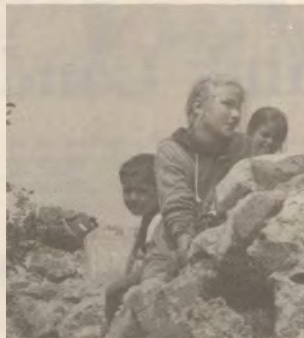
Felmásztunk a hasznosi vár romjaihoz