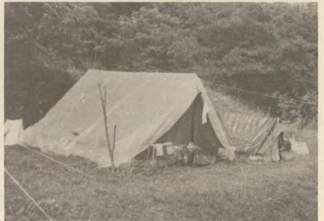
A mi fóliával letakart sátrunk jól védve volt az esőtől