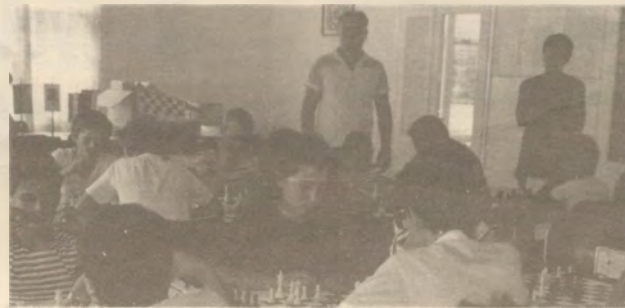
Ez egy jó parti volt