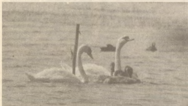
Bütykös hattyúk a „rút kiskacsákkal”