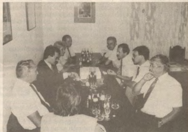
Felvételünk az aláírási ünnepségen készült