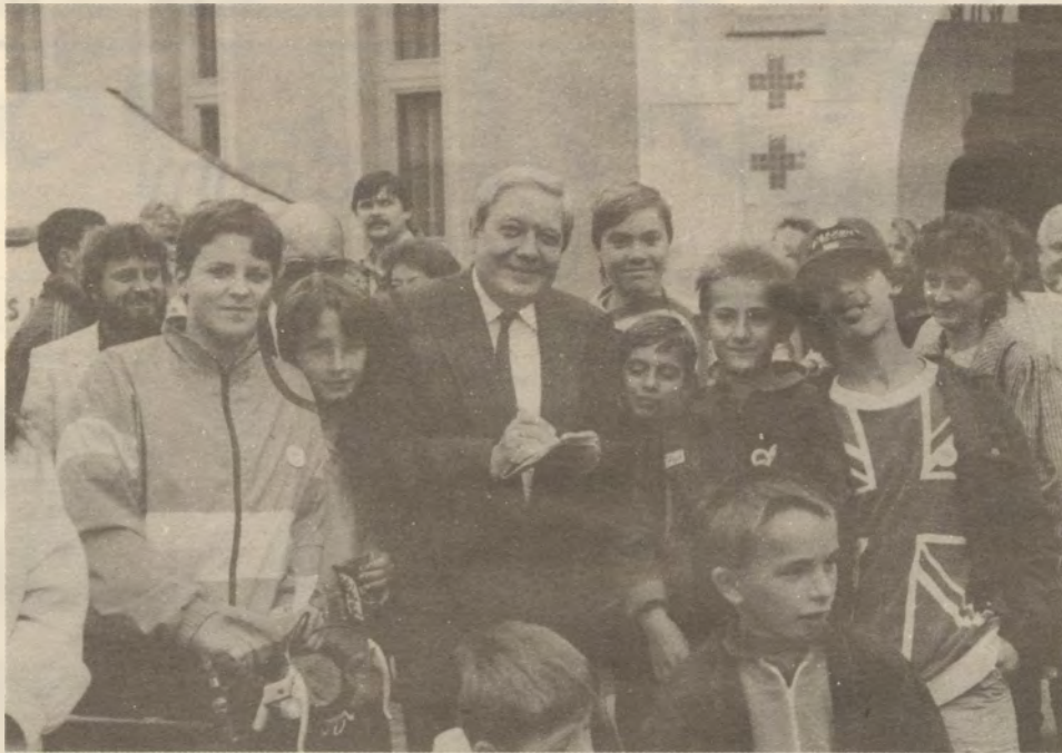
A kép a szüreti mulatságon készült. A bekarikázott gyerekeket könyvjutalomban részesítjük. Kérjük jelentkezzenek a Katona J. u. 1. sz. alatt. halasi szocialisták (X)