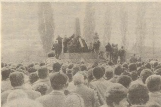
Felvételünk a koszorúzáson készült

Két kapun át özőnlöttek az emberek az emlékműhöz. A kapu mellett alkalmi