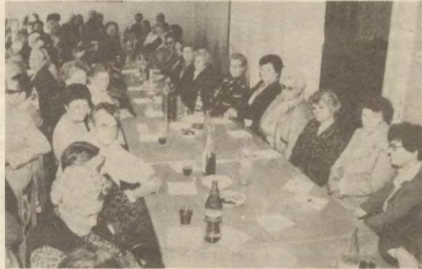
A TEXCOOP nyugdíjasi letörten hallgatják a szomorú híreket.

Ujszászi Lajos, a TDSZ szervezetpolitikai szakértője válaszolt. Elmondotta, hogy sok helyen csökkentik majd az üdülő férőhelyek számát, mert ezek egy részét éppen a kedvezményes üdülétes fedezésére kiadják teljes árú beutalókkal. A jövőben majd valószínűleg kettéválk a kedvezmény és a beutalási lehetőség. Kép-szöveg: Lévay Kálmán