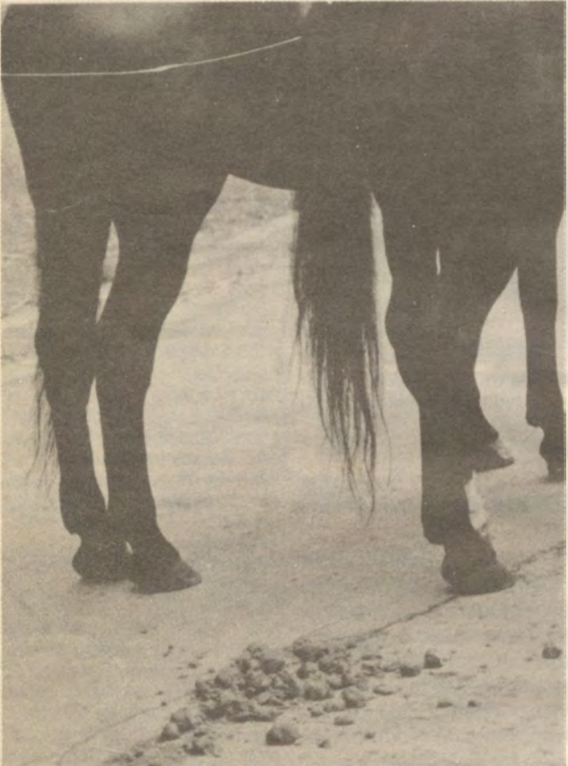
Benzingözös, füstös, vegyszerekkel mérgezett környezetünkben szinte üdítőleg hat a lócsin.