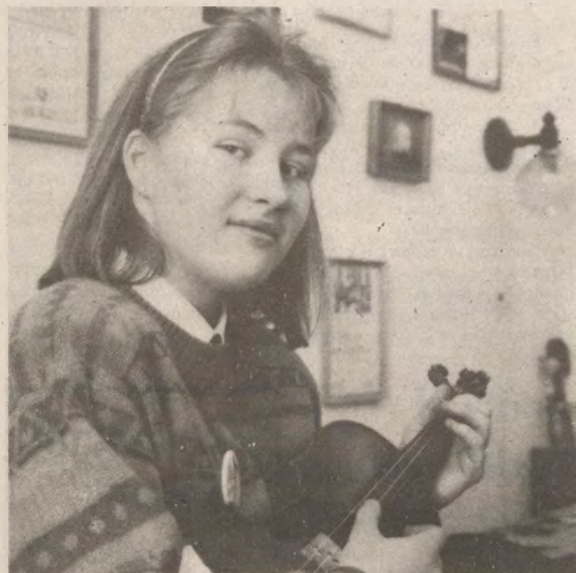
Zádory Édua a siker útját járja Cikkünk a második oldalon olvasható.