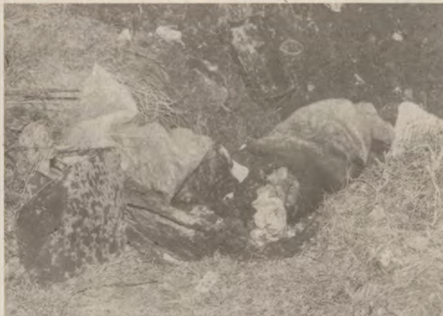
Döglött malac a zsákban.

A Szabadkai úton visszafelé haladva a DÉMASZ által szakszerűtlenül csonkolt fák tarkítják az utat a villamos vezeték nyomvonalán.