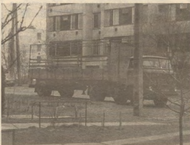
„Fűtáposó” a Schönherz Z. u. 7. sz. tömb előtt.

1991. április 18. A Polgármesteri Hivatal Műszaki Osztálya udvarias hangú levélben felszólított 129 fuvarozót, hogy járművét saját vagy valamelyik központi telephelyen helyezze el legkésőbb 1991. június 1-ig. Parkolásra felajánlott telephelyek a következők: Ganz, Volán,