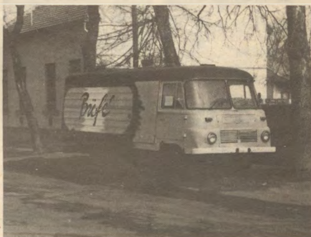
Valaha mozgó volt, most csak áll... a Szilády Á. u. 37. sz. előtt.