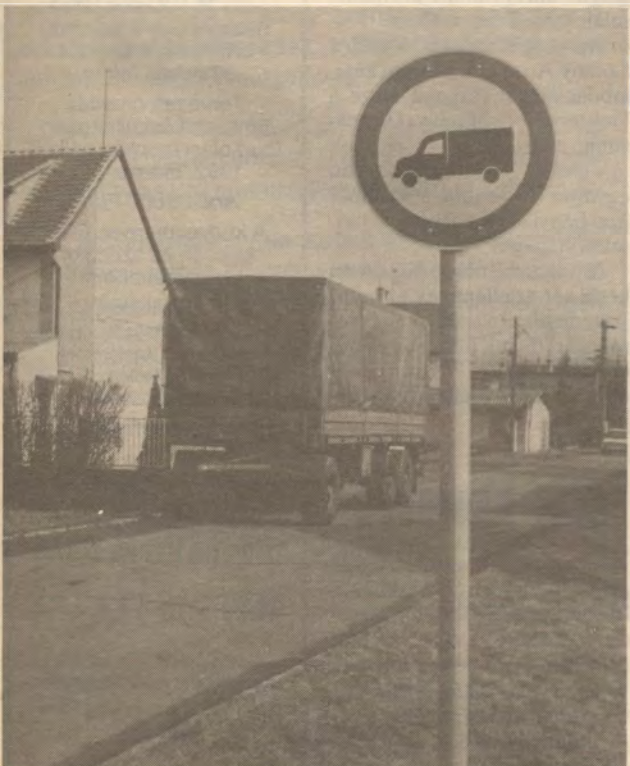
A Kilián Gy. utca végén „felejtett” pótkocsihoz nem kell kommentár.