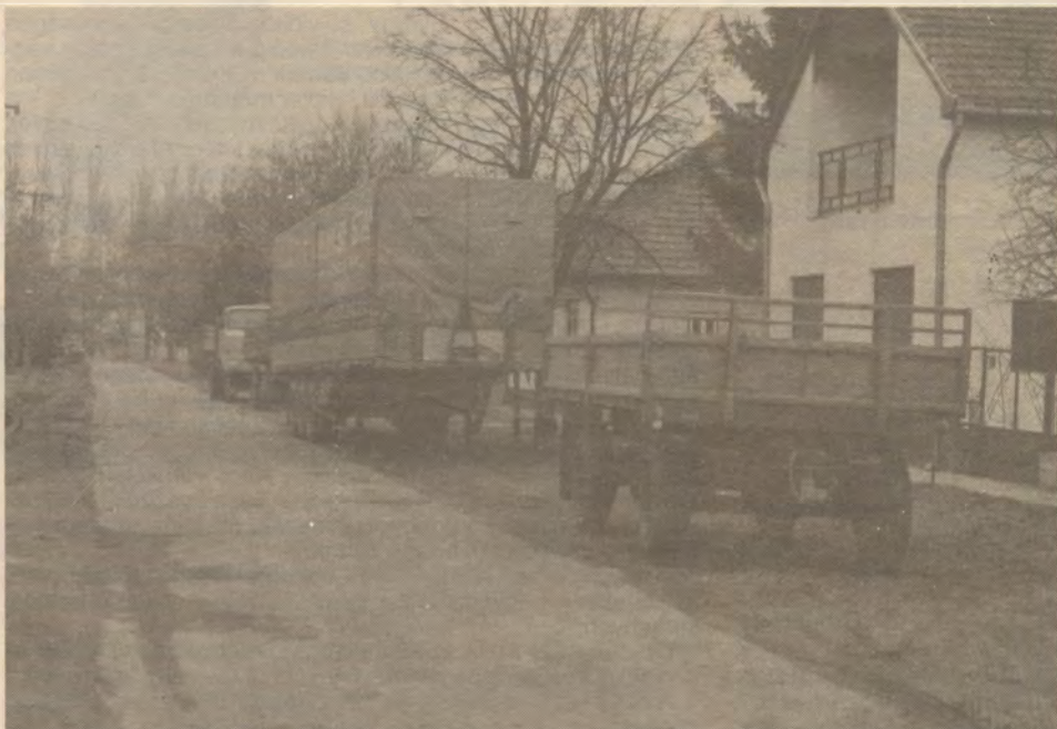
A Zrínyi u. 46. sz. ház előtti gépek gazdája így értelmezi a célforgalmat.