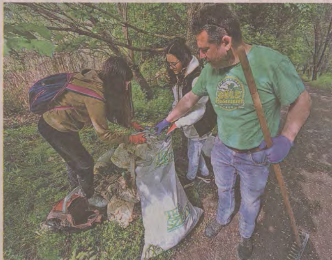
A környezet védelme a legfőbb cél

A TeSzedd! akció egy olyan hazai jó gyakorlat, amely keretén belül az önkéntesség lehetőségével akár egy kirándulás során is lehetünk, ha különle-