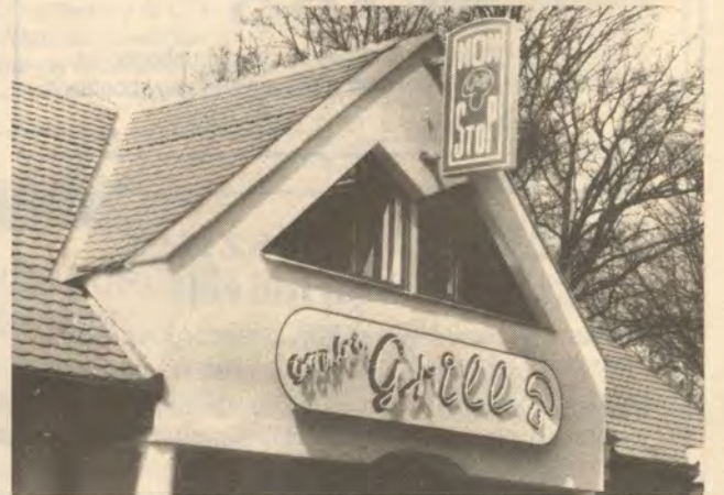
A régi halasi „gomba” az új grill homlokzatán.