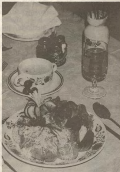
Íme az ajánlat

a lisztet, sütőport, csipetnyi sót hozzáadagoltuk. Kizsirozott, lisztezett tepsibe öntjük, és középhőmérsékletű sütőben kezdjük sütni. Ha kissé megszilárdult rákuk a feldarabolt törött fahéjjal, cukorral ízesített rebarbarát. Tovább sütjük, mielőtt kész lenne, tegyünk a tetejére keményre vert, cukrozott tojásfehérjét és lassú mérsékelt sütéssel szárítsuk rá. Sütés után pihentetni, hűteni kell. Vízbe mártott késsel szeleteljük ízletes darabokba.