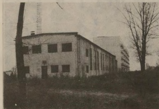
Ha a Szegedi úti volt tiszt lakásokat sikerül megvásárolni, 24 önkormányzati lakással több lesz

felmerült annak a gondolata, hogy a költségek fedezésére hitelt vesz fel, a hitelező azonban 27 %-os kamattal tudná a pénzt biztosítani. Az ezzel kapcsolatos tárgyalások egyébként folyamatban vannak, a pénzügyi ellenőrző bizottság is tárgyalja a kérdést.