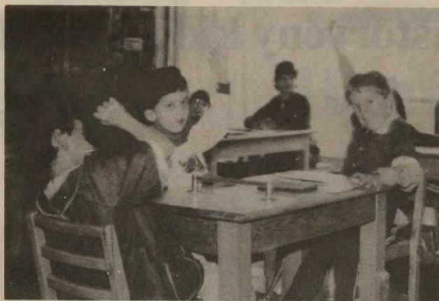
A gyerekek foglalkozás közben

három konduktor, illetve konduktor-tanító is tevékenykedik, így egy-egy témakörben, illetve tantárgyban különböző módon differenciálnak aszerint, hogy foglalkoztatott, ki-egésztő, vagy normál szinten fejlődik a gyerek. A tananyag ugyanaz, mint minden oktatási intézményben, csak a módszerek mások. Sokkal több odafigyelésre van szükség, hogy a figyelmüket ébren tudjuk tartani, hiszen reggel nyolctól este hét óráig folyamatosan dolgoznak: írnak, olvasnak, esznek és mozognak, s közben állandóan figyelniük kell a helyes kéz, láb és testtartásra.