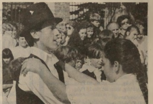
Szép, lendületes volt valamennyi együttes tánca, de a halasiak sem maradtak el mögöttük. A halasi közönség nagy szeretettel fogadta őket.

Az erdélyi Háromszék tánc-együttes különösen szép színfoltja volt a felvonulásnak. Pezsgő ritmusuk, szilaj táncuk hamar felmelegítette a lelkeket. A közönség körében méltán arattak oly nagy sikert. A csoport tagjai elmondták, hogy boldogan jöttek, és köszönik a meleg fogadtatást. Jövőre is számíthatunk rájuk.