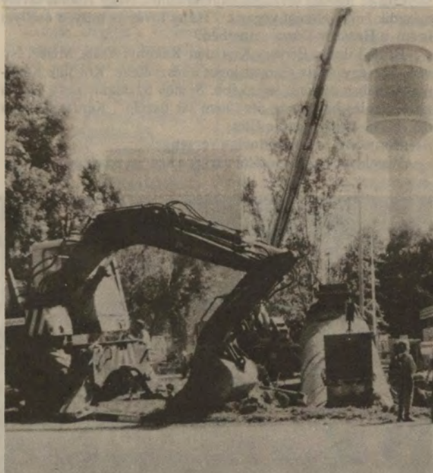
Munka a TOTAL kútnál