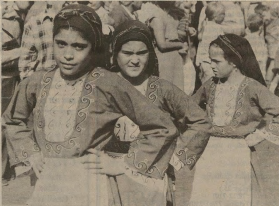
Egy egész folklór fesztiválra való népi együttes látogatott el hozzánk a szüreti rendezvényekre. Képeinkön a ciprusi leánykák, akik most jártak itt először. Reméljük, nem utoljára!