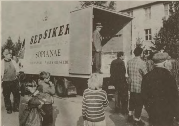
Kíváncsi tekintetek a rakomány körül.

A karácsonyi filmszínház-beli segélyakció óta tovább folytatta munkáját a halasi Vöröskereszt. Így az étel-miszer mellett ruhaneművel is ellátták a rászoruló idős embereket és a nagycsaládosokat, valamint a városban, és kör-