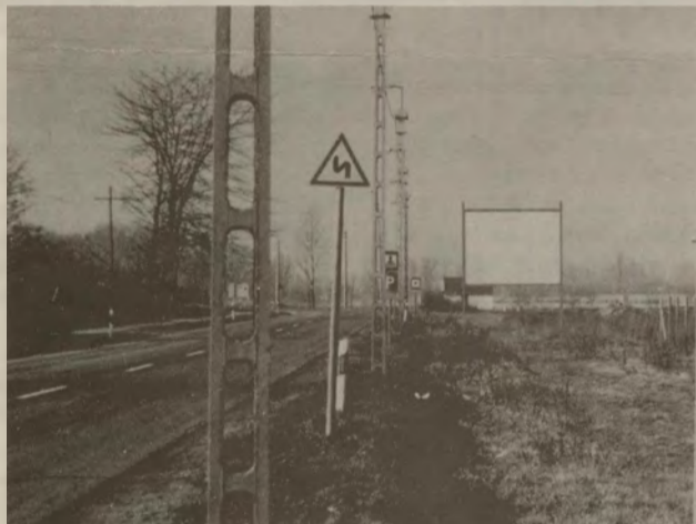
Tisztán, fehéren díszleg Halas határánál a hirdetőtábla.

Az utóbbi időkben az autók egyre gyakrabban láthatnak az országút mellett különböző, hatalmas méretű reklámtáblákat. A kínálat a termékkála különböző rétegeiből, megannyi jópofa szöveggel. Sóstó előtt, hónapokon keresztül hirdette a felirat, hogy a jó erős Symphonia az igazi. Érvényben lévő jogszabályaink nem teszik lehetővé a cigaretta reklámozását. Azaz egyféléképpen igen. Ha a táblán ott fityeg az a felirat is, hogy a dohányzás káros az egészségre.