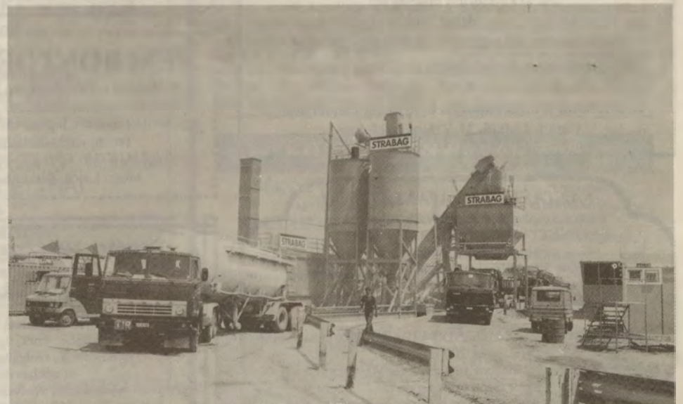
Csúcsmínőségű technológiával a legjobb munkát adják.

Itt a STRABAG ajánlattal szemben a csökkentett műszaki tartalmú, olcsóbb ajánlat nyert.