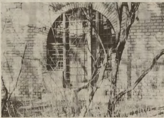
Az impozáns épület lassan átadja magát az enyészetnek.

Később lón az urbanizáció és azok a szülők, akiknek gyermekeit naponta ideszálították reklámáltak az udvari véce miatt, nem tetszett nekik a kútvíz és az illetékesek úgy döntöttek, jobb a gyerekeknek a betonrengeteg-