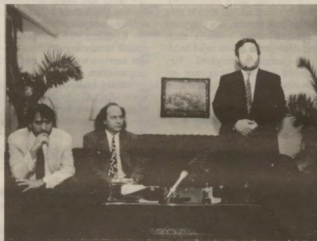
A nyugati újdonságok egyből a magyar boltokban is megjelennek - hangzott el a sajtótájékoztatón.

Dalai a diszkóba utaltatnak, ahol minden vígan ropogtatja a korunk elvárásai szerint készült ügyes, de lélekte-