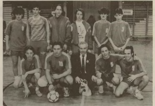
A győztes szegedi csoport (Fotó: Ferincz).

A II. Rákóczi Ferenc Mezőgazdasági Szakközépiskola rendezvénye már húsz éve városunk egyik legismertebb és várva-várt sporteseménye.