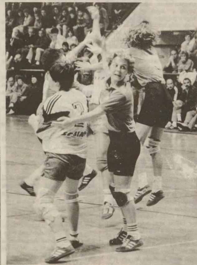
A győzelmet nem adják ingyen!

Hátralévő mérkőzések: FÜSZÉRT-Szarvas Szirén SE 26:18, Balmazújváros-FÜSZÉRT 10:24, FÜSZÉRT-Postás 10:31, Medicor-FÜSZÉRT 11:07.