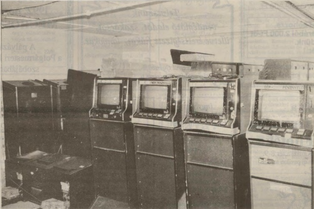
A kaposváriak raktárában még sok játékgep vár "vizsgálatra".

Elindultam felkutatni az ismeretleneket. Időközben arról informáltak, hogy a begyűjtött gépeknek nyoma veszett. A helyreigazítási kérelem 1992. október 2-án faxon érkezett. Még ezen a napon a Népszabadság arról tájékoztatót, hogy "évi öt-milliárdra is rúghat a költségvetés vesztesége" szerencsejáték ügyben.