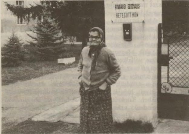
A bejáratnál a gondozottak adnak szolgálatot

- Elfordulnak tudathasadásos elmezavarban szenvedők,