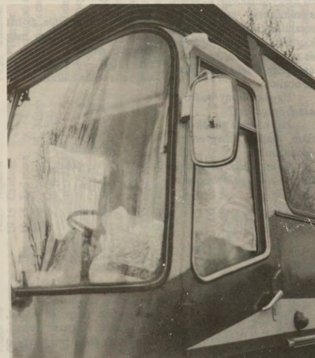
A betört ablak...