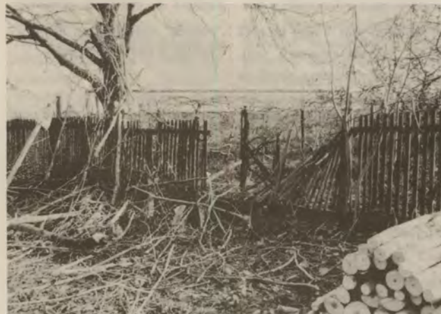
A döntés ilyen kifogásolható módon sikerült.

A fakitermelő etnikum arra hivatkozott, hogy nem tudja másképpen megoldani a döntést, hiszen a megrendelő ehhez nem biztosított emelőeszközöket. A tulajdonosokat ez nem