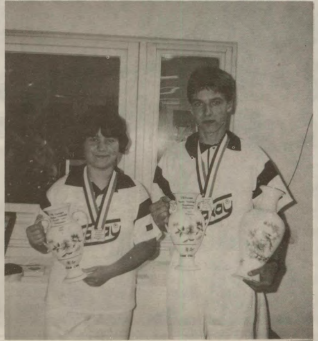
Újabb serlegekkel gyarapodva...

CSB női kategóriáját is. Dobogós helyezéseivel tucatnyi érem, oklevél járt, melyek közül kiemelkednek a megyei ifjúsági egyéni versenyeken, valamint a Halas Kupán