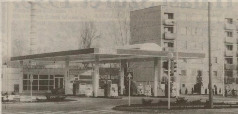
Itt húzódná a "Halasi nagyfal"?

szült a biztonságosabb közlekedés érdekében. A gépkocsik itt a tilos jelzésnél kénytelenek megállni és utána innen indulva túráznak, ami nagy zajjal jár. Tehát a fékezéskor nagy csikorgás, az induláskor erős motorzaj. Ez a lámpás gyalogátkelőnél is így van. Különben a zajmérést végző szakemberek azt is megállapították, hogy a déli irányból erre haladó gépkocsik-