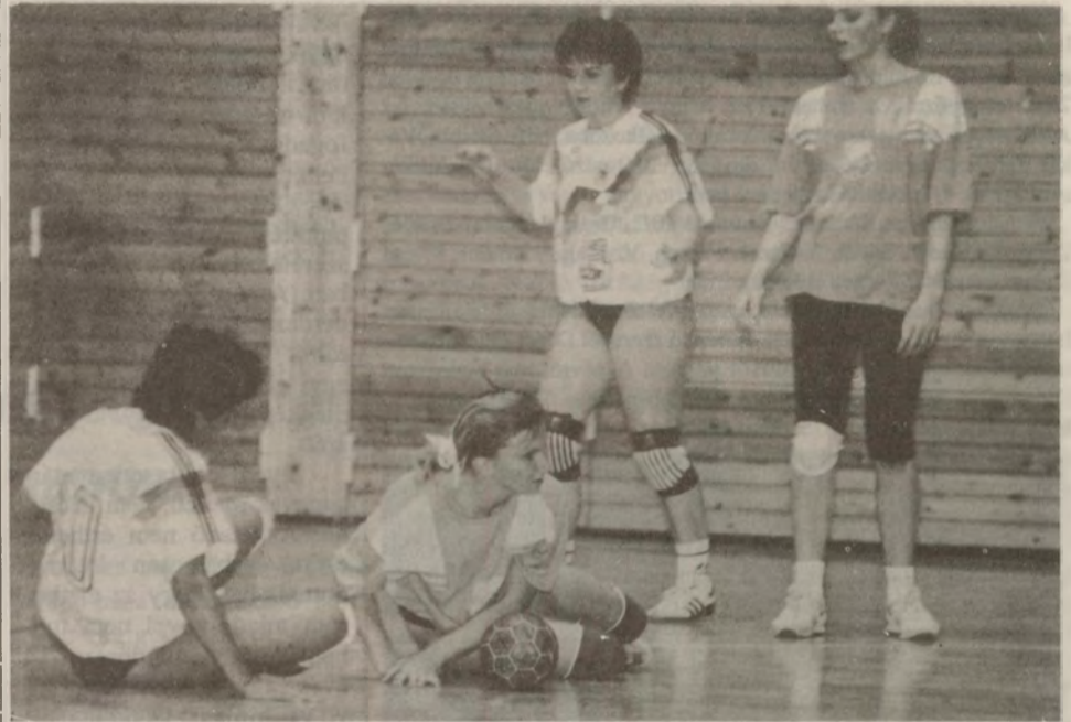
Néha a szokottnál többen kerülnek padlóra, itt például Burainé is.

kézilabda ma is arra épül, amit évek folyamán - barátaim támogatásával - létrehoztam. Ezért hát nemcsak jogom, úgy érzem kötelességem is megszólalni akkor, mikor látom nyilvánvaló tévedéseket és tudom, hogy majdan ennek kárát nem az elkövetők szenvedik el, hanem mi, az érdemtelenül mellőzöttek, a csalódottak, vagyis a halasiak. Valamint azok is, akiket annak idején jobb perspektíva reményében hívtam Halasra, akik itt gyökeret vertek, akiket a Halasiak szívükbe zártak. Végső soron a helyi kézilabdázás szenvedni majd kárát, amely a mi munkánk során válhatott városi közzüggé. Az eddig sem zavart, hogy kik és mikor akarnak osztozni a Fűszert SE sikerein, de hogy ezt a friss sarjadást gyökereitől kitépjenek és idegen földre ültessék, nem hagyom. De beszéljenek helyettem a tények. Az elmúlt évben szerény körülmények között, megbecsülve mindazt, amink van, tisztelve minden segítséget, a lelkesedéstől hajtva megnyertük a bajnokságot és jogot szereztünk az NB-I-es szerepléshez. Munkánkat, eredményünket a közönség hálás ünnepléssel jutalmazta. Akkor ez volt a legtöbb, amit adhatott. A csapat halasivá lett, akiket a helyi szakemberek vezettek és itteni önkéntesek segítettek. A költségek a bajnoki jutalommal sem haladták meg a 3 millió forintot. Hogy akkor miért nem éltünk az NB-I-es indulás jogával, vagy miért hagytam kicsavarni a vezetést a kezemből, az egy más kérdés. Azon-