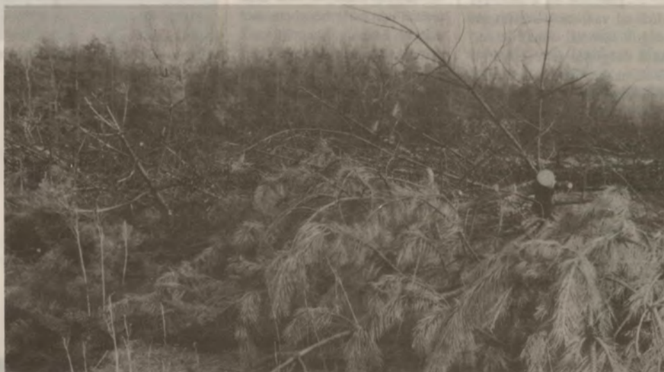
A Harkakötöny alatti erdő is a gyújtogatók és a lángok martalékává vált. Vajon előkerülnek a felelősök?