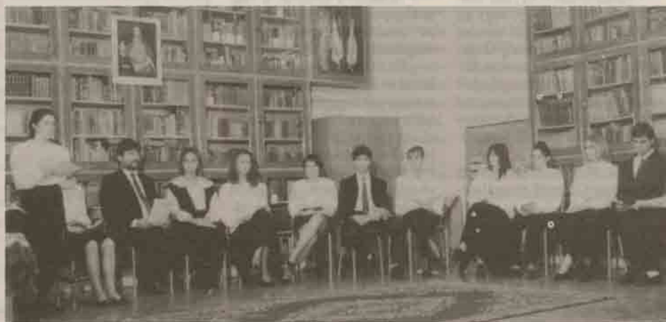
A magyar reneszánsz irodalom hő tolmácsolói...

Kik is azok, akik valójában nagyra tették őt? Az előtte járók között találjuk azokat a híres zsoldárszerzőket, akik a reformáció szellemében született verseikben az ószövetségi történetek mellé a kor társadalmi és politikai vonatkozásait is beleszőtték - mint például Farkas András, Batizi András, Szkhárosi Horváth András, Ilosvai, Méliusz, illetve Bornemissza Péter-, vagy azokat a világi historias énekszerzőket, akiket a múlt történelmi témái mellett saját koruk eseményei, a török uralom és a három részre szakadt Magyarország sorsa is meghihletett. Ki ne ismeremé Tinódi Sebestyént, legjelentősebb történelmi énekmondókat, akinek beszámolóit már az általános iskolában