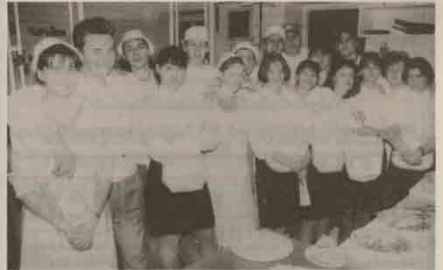
A lelkes csapat