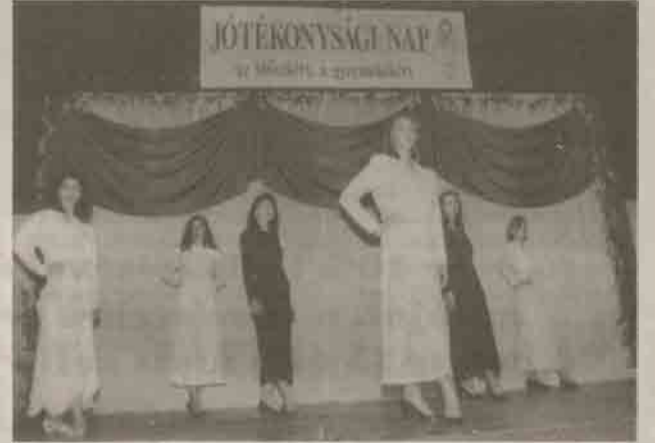
Színpadon a Stúdió Vogue.

A délutáni programsorozat hat általános iskola - a Fazekas, az ÁMK, az Alsóvárosi, a fehértói, a harkakötönyi és a szanki - játékos sportvetélkedőjével kezdődött. A résztvevők összemérhették felkészültségüket mi-