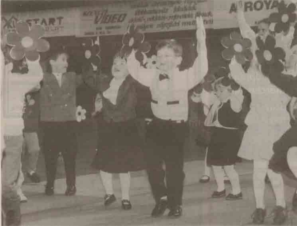
Velük és értük jött létre a rendezvény.