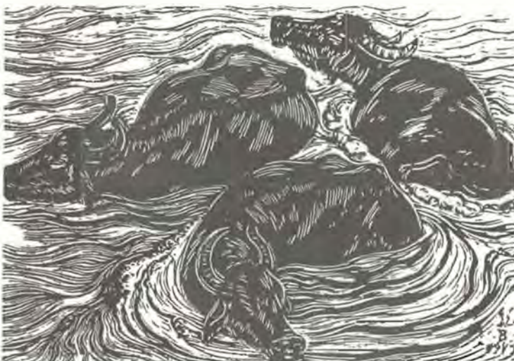
Gy. Szabó Béla: Fürdő bivalyok 1949.