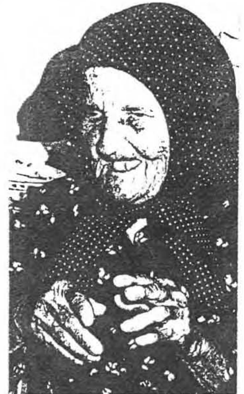
Banga néni 105 éves

*Előző számunkban megkezdett új élettörténet hibásan a régi, Józsi bácsi címmel jelent meg. Ezúton kérjük Zoltán bácsi és olvasóink szíves elnézését. (szerk.)