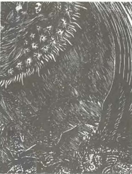
Gy. Szabó Béla János: Jelenések (1977.)

Alszik a szív és alszik a szívben az aggodalom, alszik a pókháló közelében a légy a falon, caönd van a házban, az éber egér se kapargál, alszik a kert, a faág, a fatörzsben a harkály, kasban a méh, rózsában a rózsabogár, alszik a pergő búzaszemekben a nyár, alszik a holdban a láng, hideg érem az égen, fölkel az ősz és lopni lopakszik az éjben.