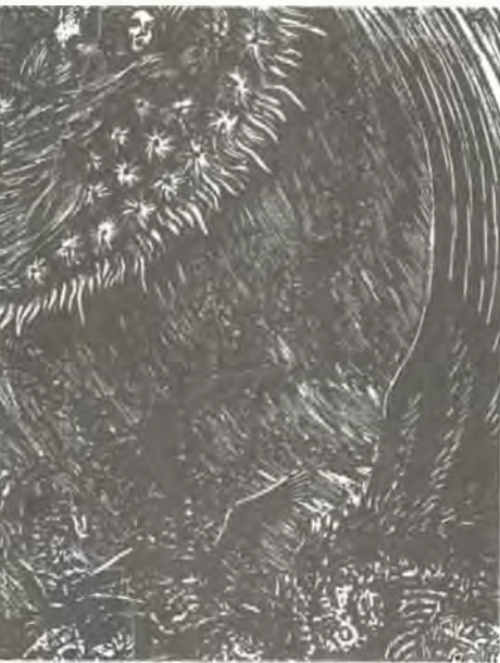
Gy. Szabó Béla János: Jelenések (1977.)

Alszik a szív és alszik a szívben az aggodalom, alszik a pókháló közelében a légy a falon, caönd van a házban, az éber egér se kapargál, alszik a kert, a faág, a fatörzsben a harkály, kasban a méh, rózsában a rózsabogár, alszik a pergő búzaszemekben a nyár, alszik a holdban a láng, hideg érem az égen, fölkel az ősz és lopni lopakszik az éjben.