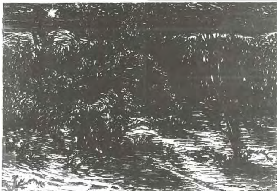
Gy. Szabó Béla