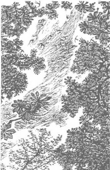
Gy. Szabó Béla Szeptember (1965)

A szomszéd rétjén mindig zöldebb a fü (?)