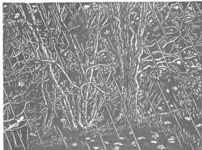
Gy. Szabó Béla

A rendőrség az ügyben a vizsgálatot lezárta, az anyagi kárt a biztosító téríti meg.