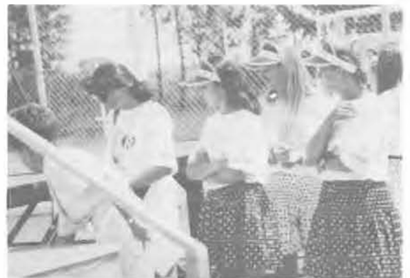
— És ide a színpad alá kell hozni a sörvőverseny győzteseit!