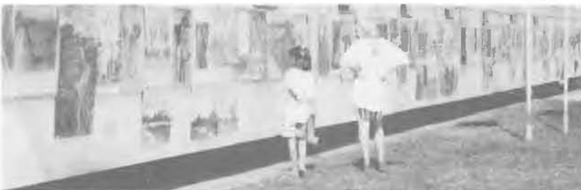
— Szép, szép, de hol vannak a srácok?