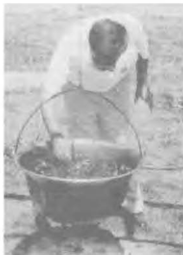
„Edd a jót, és kerüld a rosszat!”