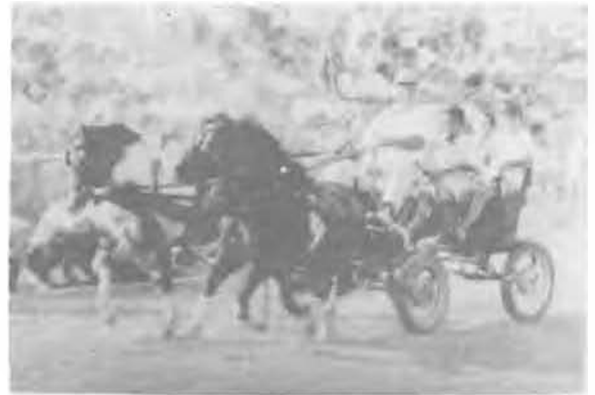
— Elhagytuk már a kalapomat?