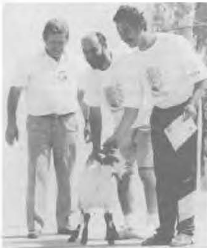
— No, fiúk, ki kezd?