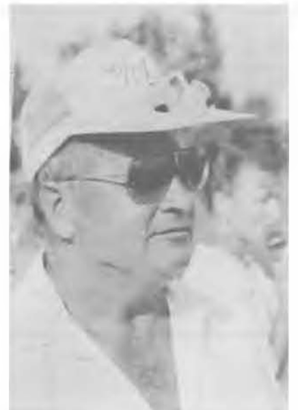
A szanki karakter