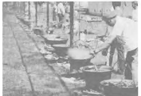
— Melyik is az én bográcsom?