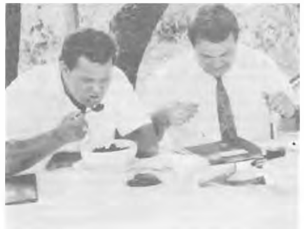
— Aj-aj, hát nem megettem a tányéromat is!