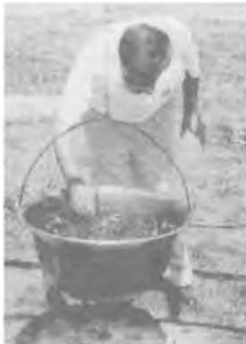
„Edd a jót, és kerüld a rosszat!”