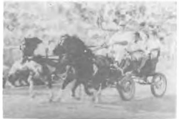
— Elhagytuk már a kalapomat?