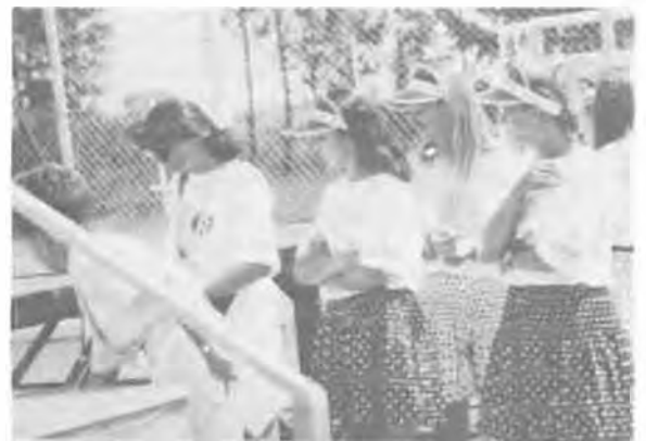
— És ide a színpad alá kell hozni a sörvőverseny győzteseit!