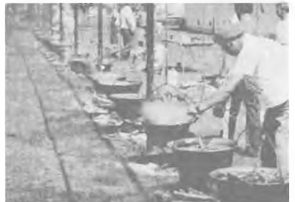
— Melyik is az én bográcsom?