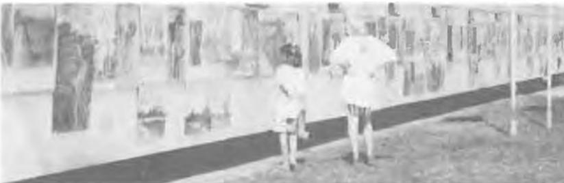
— Szép, szép, de hol vannak a srácok?