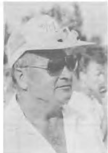
A szanki karakter