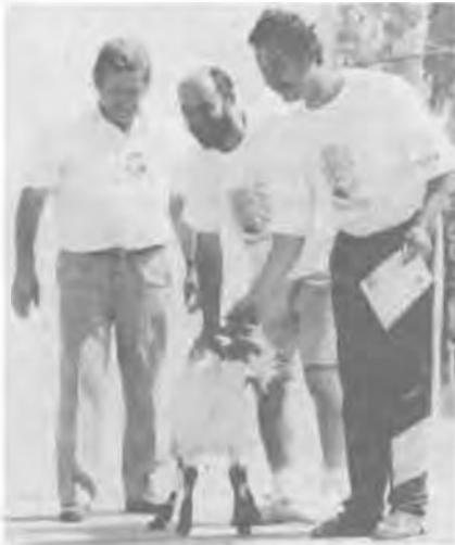
— No, flúk, ki kezdi?