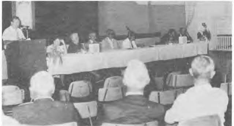
A falugyűlést a nagy érdeklődésre való tekintettel jövőre újru rendezzük.