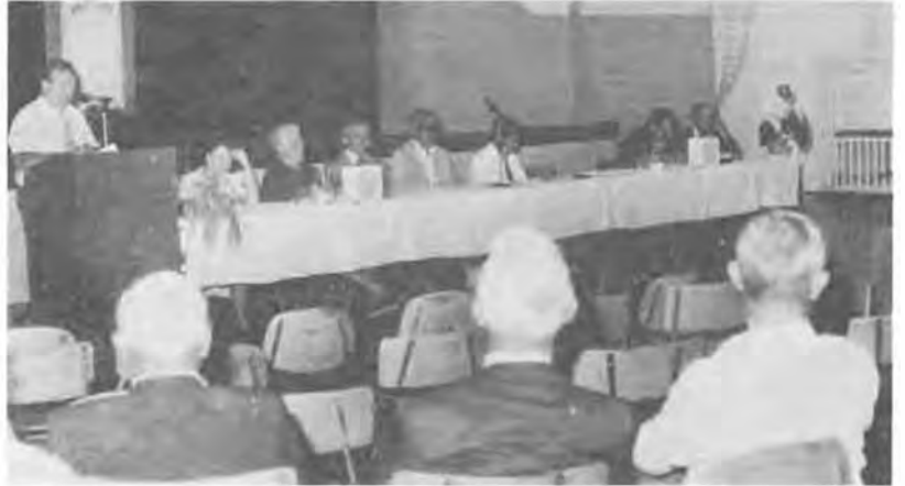
A falugyűlést a nagy érdeklődésre való tekintettel jövőre újru rendezzük.