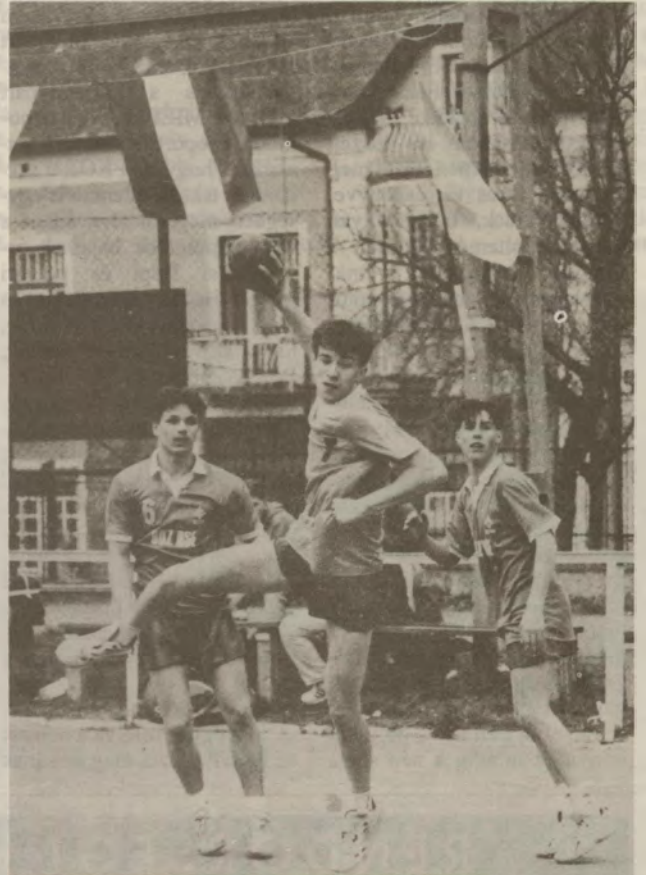
Tekósok akcióban.

A rendezők testnevelő-tanári is szívesen nyilatkoztak lapunknak csapataikról, eredmé-