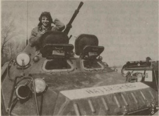
Fokozák az ellenőrzést.

kísérletek növekedése, a menekült áradat erősödése mellett az elmúlt 3-4 év legszembetűnőbb tendenciája, hogy ugrásszerűen megnövekedett a jogellenes cselekmények elkövetése, és több köztörvényes bűncselekmény vonatkozásában megjelent a nemzetközi bűnözés - hangzott el a Kiskunhalasi Határőrség Igazgatóság szokásos évi sajtótájékoztatóján.