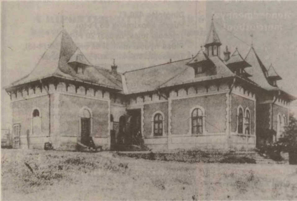
A kórház ősi épülete, a Besenyei kastély

vonatkozású műve "Rövid kritika és rajzolat a magyar fűvésztudományokról", amely 1893-ban jelent meg.