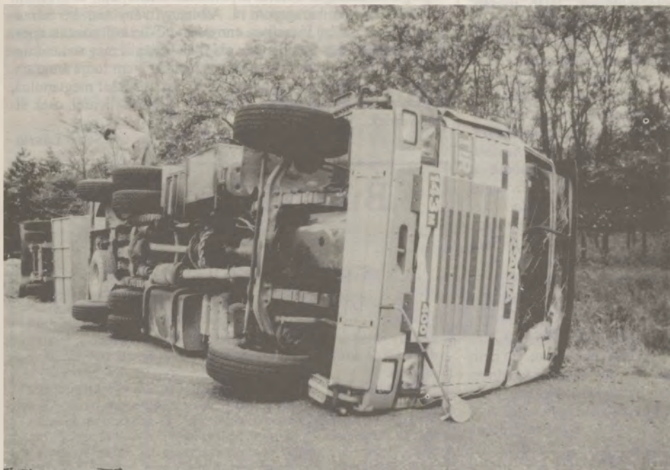
Tragikus "bárány áldozat" színhelye volt április 19-én a majsai út Harkakötöny és Kiskunhalas közötti szakasza. Tudósításunk a 12. oldalon.