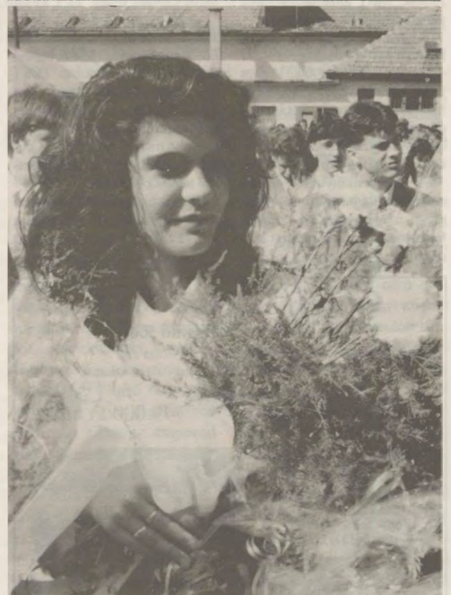
(Ballagási beszámoló a 11. oldalon.)

A KISKUNHALASI NŐI KÉZILABDA SE NB.I.B-S BAJNOKSÁGBAN SZEREPLŐ CSAPATA UTOLSÓ HAZAI MECCSÉN ISMÉT ELSŐPRÓ FŐLÉNNYEL ARATOTT GYŐZELMET, TÖRTÉNETESEN A KÖZÉPMEZŐNYBEN HELYET FOGLALÓ TÖKÖL SE GÁRDÁJA FELETT. VÉLHETŐEN TAVASZI GYŐZELEMHADJÁRATÁNAK UTOLSÓ ÁLLOMÁSA, JÁSZBERÉNY SEM TUDJA ELTÉRÍTENI A KITŰZÖTT CÉLTŐL, A NEMZETI BAJNOKSÁG ELSŐ VONALÁTÓL.