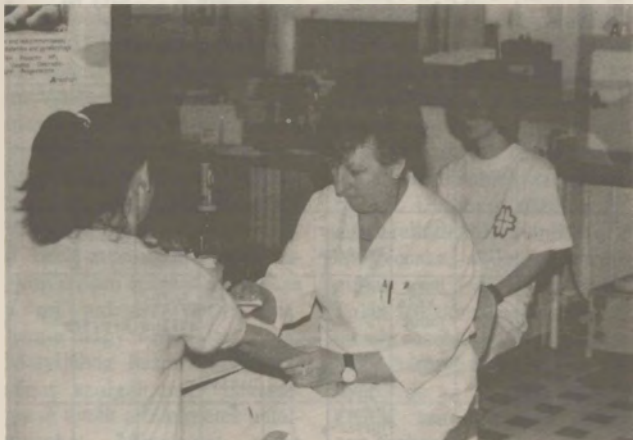
A bérpótlékok csak ideig-óráig oldják meg az egészségügyben tevékenykedők helyzetét...

Értelmében azonban mégsem beszélhetünk igazán, bár tény, hogy kevés az ápolónő. Ez egyrészt a saját, de leginkább gyermekeik megbetegedése miatti táppénzes állományból adódik, illetve szülés, GYES következtében alakulhat így. Ezen kívül néhány szakdolgozónk megélhetési nehézségein könnyítést remélve vállalkozásba kezd, vagy vállalkozóhoz társul. Ezeket az eseteket kivéve azonban - noha nővéreink bére csöppet sem kielégítő - hivatás-tudatuk, vagy talán az ahhoz való ragaszkodásuk révén mégis