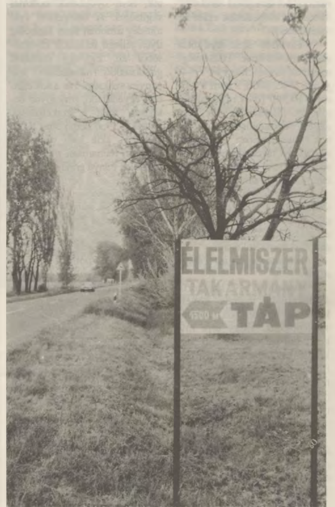
Kinek mire telik mostanában.