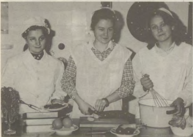
Munkában a szakmunkástanulók az iskola tankonyhájában.

Városunk középiskoláiban a napokban fejeződött be a ballagás, és kezdődött el a nagy számadás, az érettségi avagy a szakvizsga. Néhány hét eltéréssel minden tizenhét-tizenkilenc éves diák kézhez kapja bizonyítványát, amit egyesek fiókba tesznek, míg mások továbbvisznek magukkal a felsőoktatási intézményekbe. Vajon hányan mennek tovább, kik lesznek azok, akik egyelőre munkába állnak, és mi lesz a munka és tanulás nélkül maradottak sorsa? Róluk, s utódaikról, a középiskolákba idén jelentkező 12- és 14 évesekről kérdeztem Kiskunhalas gimnáziumainak, szakközép- és szakmunkásképző iskoláinak előljáróit.