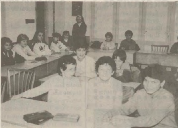
A hatalomra kerülő kormány nem szabad abba a hibába esnie, hogy az egyházat újra perifériára szorítsa

kában. Ha a családot valamilyen módon meg tudjuk újítani a jövőben, azt hiszem, a társadalmat is erősebbé, egészségesebbé tehetjük. Abban reménykedem, hogy a nagycsaládok és világiak itt tapasztalt érzékenysége és összefogása révén többet tehetünk a családokért, mint ezidáig. Én, mint főpásztor, munkatársakat hívok és várok, s bízom abban, hogy ez a jó értelemben vett alulról építkező szinódus sokkal eredményesebb lesz,