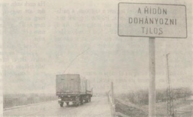
Ráadásul - ha valaki nem tudná - mindkét irányból