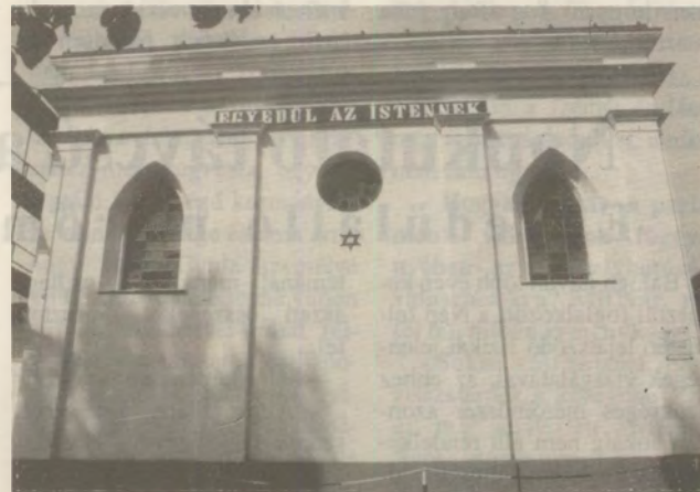
A felújított zsinagóga.

A 140 esztendő zsinagóga immár felújítva várja a hívők,