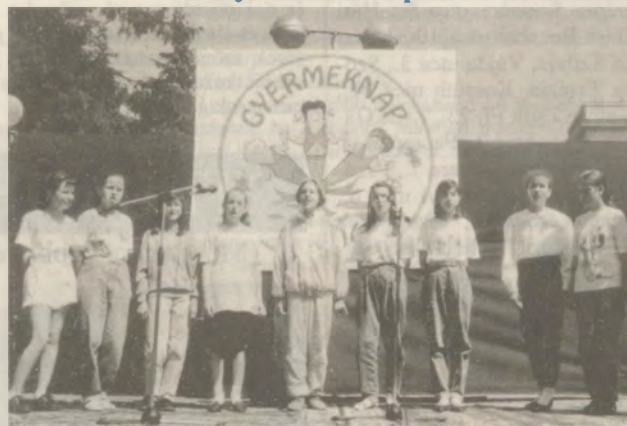
Tudósításunk a 2. oldalon.