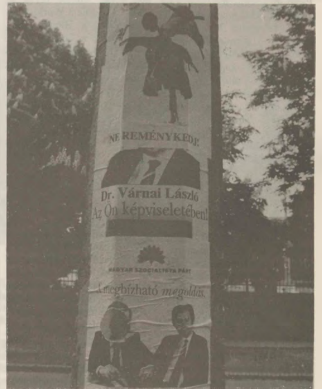
Jó, jó, dehát az a pufajka... az nem kéne a képbe!