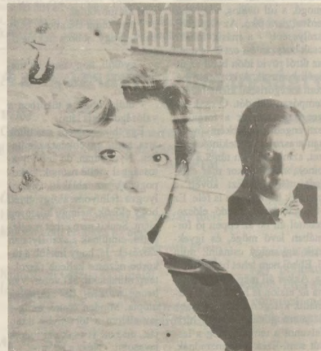
Egy "palotás" bájosmosoly és liberális hűvösség