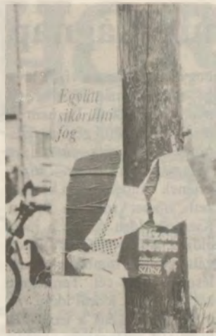
... a szakítópróba. Legalábbis...