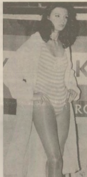
Divat - showal nyitotta meg kapuit a nagy közönség előtt az elmúlt hetekben az Akropolis kert helyiség a város szívében. Képriportunk a 12. oldalon található.