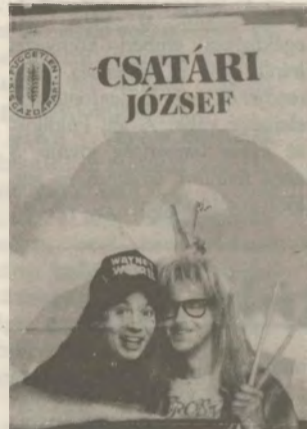
Haza, Család, küzdő elődeink szellemi hagyatéka, Wayne's világa valami nagy-nagy tüzet kellene...