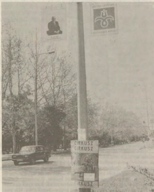
Nem mi mondtuk...