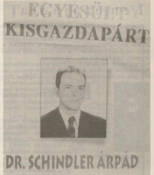
A programok egyeztetése még tart