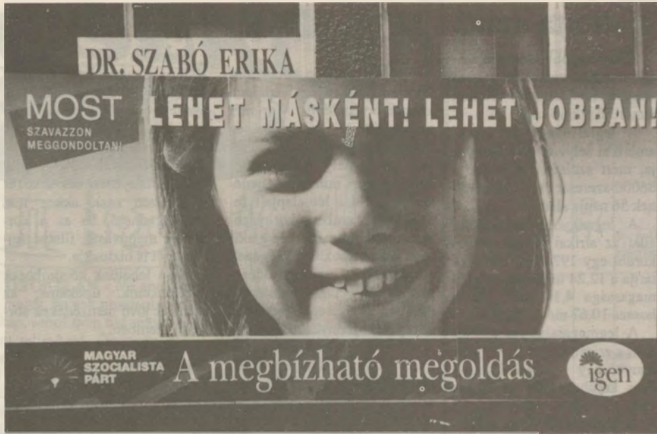
Lányos zavar - a koalíciós tárgyalások előestéjén