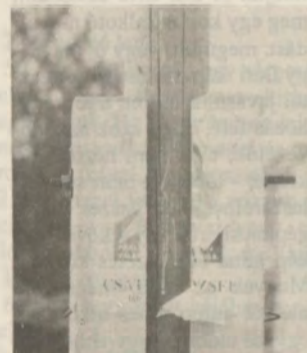
Nem bírta a gyűrődést