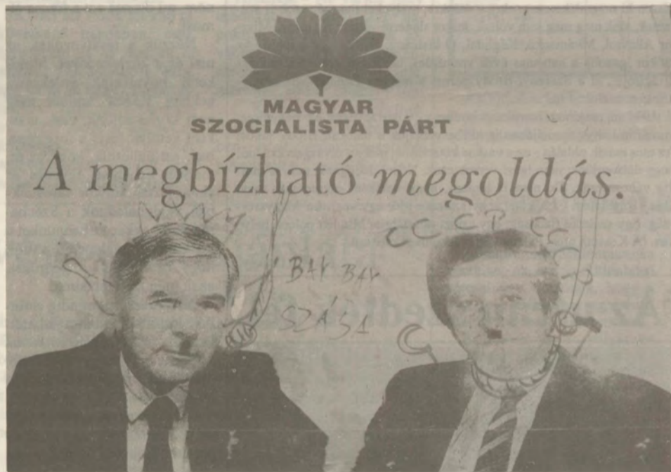
Bye, bye Szasa - eredeti, kreatív helyesírása... /Kisért a múlt/