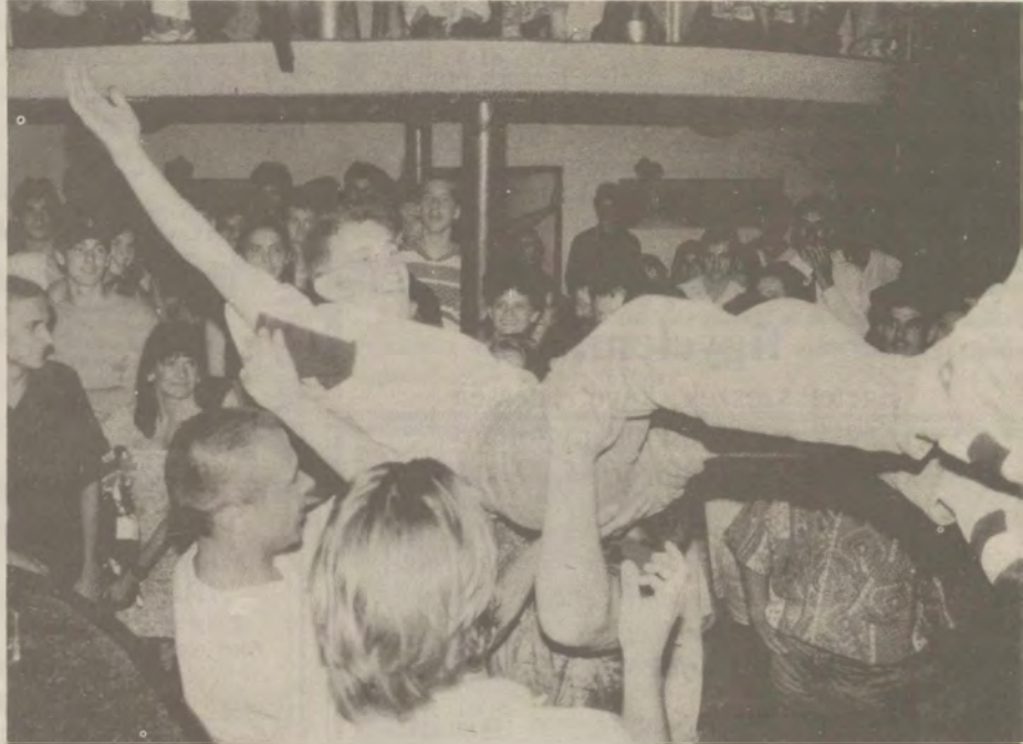
• Tombolt a fiatalság