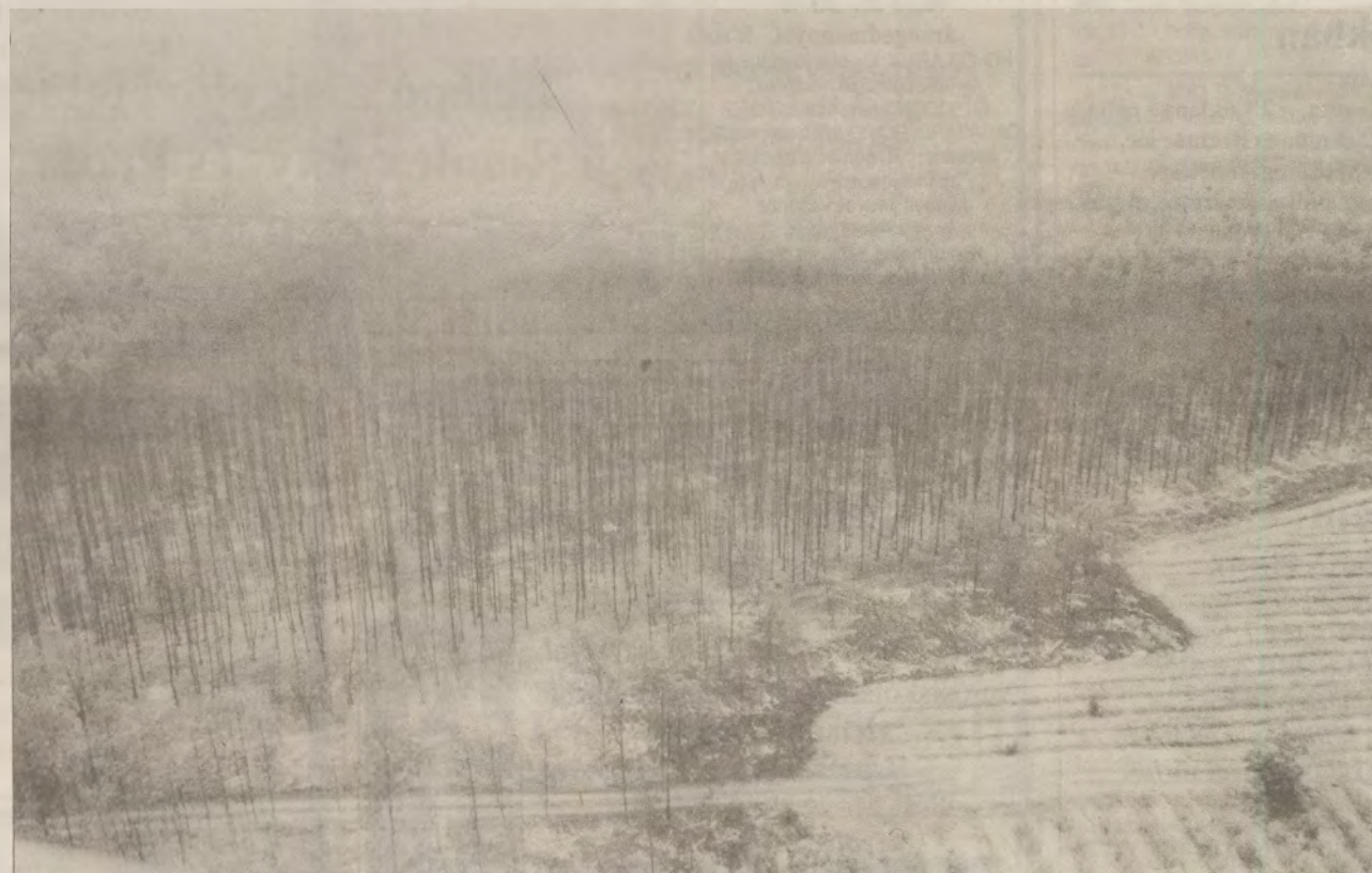
• Szomorú látvány az Aerocaritas helikopterének fedélzetéről