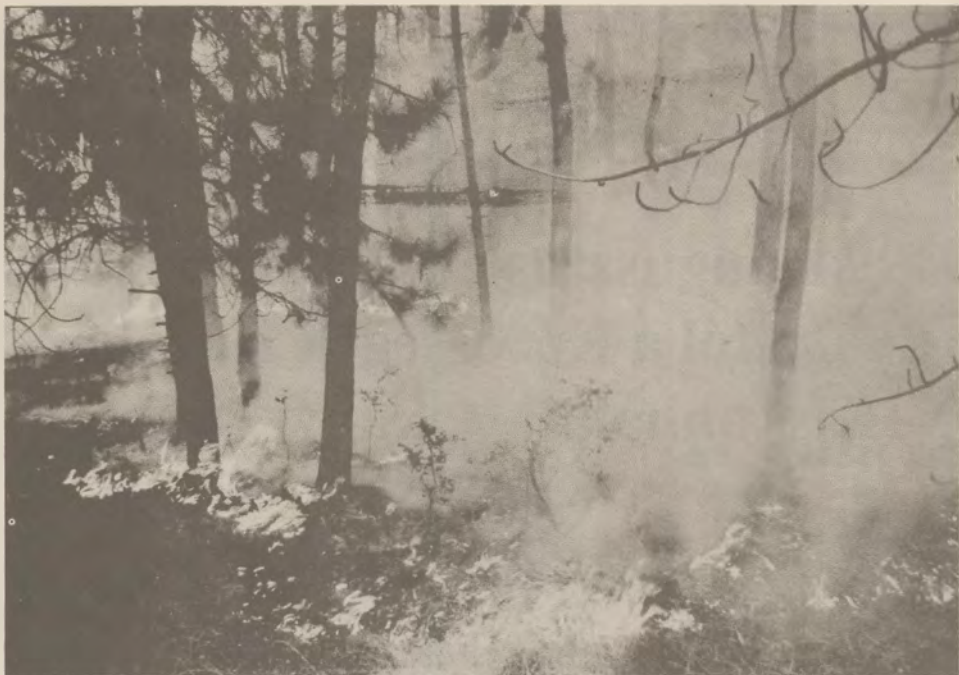
• Több mint 70 hektáron éget a 25 éves fenyő és vegyeserdő