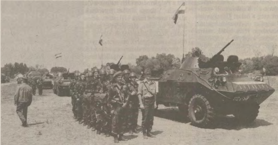
Nem az utolsó eskütétel...

- Ami információm van, arról röviden annyit mondhatok, hogy az eddigieknél sokkal szigorúbb takarékoság vár ránk. Drasztikus intézkedések-