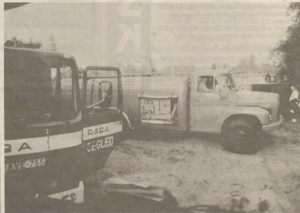
• A tűzoltóság elavult közúti járműveivel egyre nehezebb megközelíteni az erdőtüzeket.

megjósolni. Itt vannak a vizsgálók és majd felderítik. Reméljük, hogy sikerülni fog nekik.