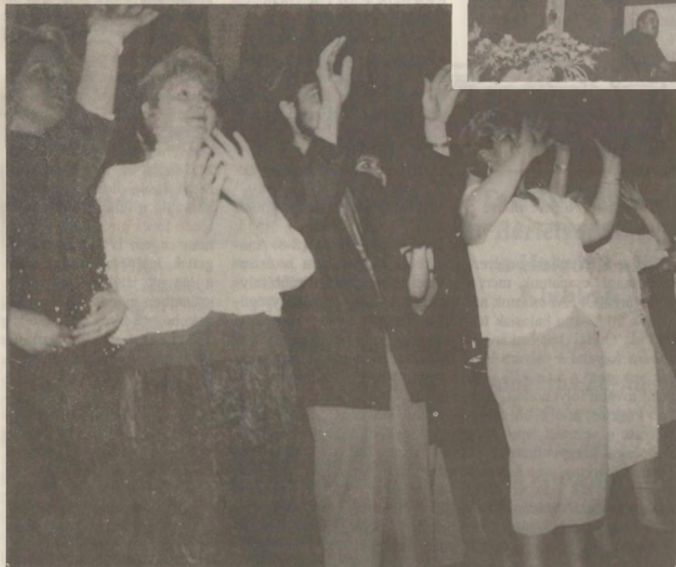
Hip - Hop Boyz