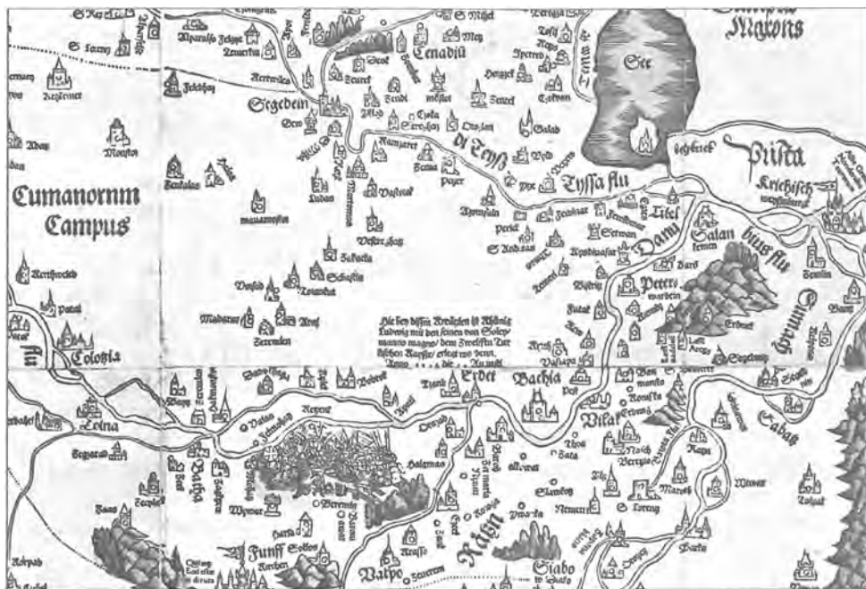
A Lázár-féle térkép (1556) részlete

ben legyenek a víznek, meg hogy legalább az egyik oldalról védje őket a halastó”. 27 Elégé egyértelmű, hogy itt az ismertebb, Tisza menti Szeged képe rajzolódik ki előttünk. Felmerülhetne persze, hogy Szeged környékén, Csongrádtól északkeletre feküdt egy Halásztelek (1493) nevű település, de ez az egri püspökség kezén volt, tehát a Tubero-féle forrással nem lenne meg az egyezés. 28