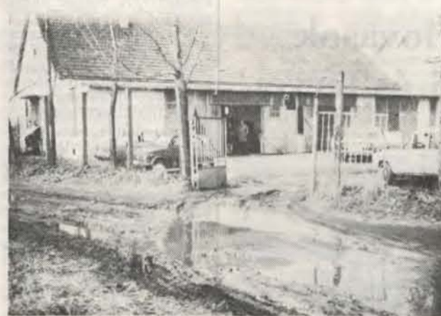
Akadálypálya az Autóklubnak.

Igen ám, de a mostoha szülő megelégedte engedetlen gyermeke fickádozásait. Intézkedett: január 20-tól a VOLÁN főkapuján csak a vállalat járművei hajthatnak be, az udvar hátsó végéhez vezető betonozott utat egyszerűen lezárták. Aki azóta az Autóklubot mégis fel kívánja keresni, ám tegye. Most ezt a kerítés melletti he-