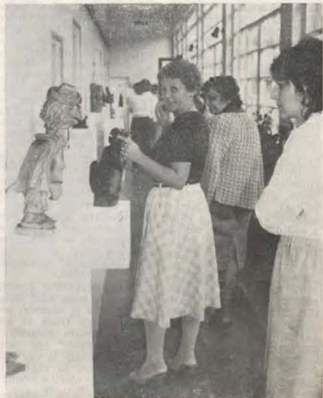
Képünk egy korábbi kiállításon készült.

Az utóbbi időben talán elénkült az érdeklődés a városban is, előfordult, hogy tanulók jöttek csoportosan megtekinteni egy-egy kiállítást. A művészet szeretete, pártolása nem mindig pénzkérdés, mint a