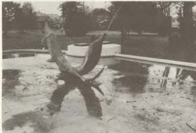
Szökőkút – a vizet magasra lövelő díszkút. (Magyar értelmező kéziszótár.) Nem tudom hány szökőkút van Halason, de az a kettő, a Lenin téri és a Semmelweis téri, nem válik díszere a városnak. Pedig a megoldás oly egyszerű: rendszeres takarítás, karbantartás! S mielőtt az illetékes elvtárs azt válaszolná, (ami egy