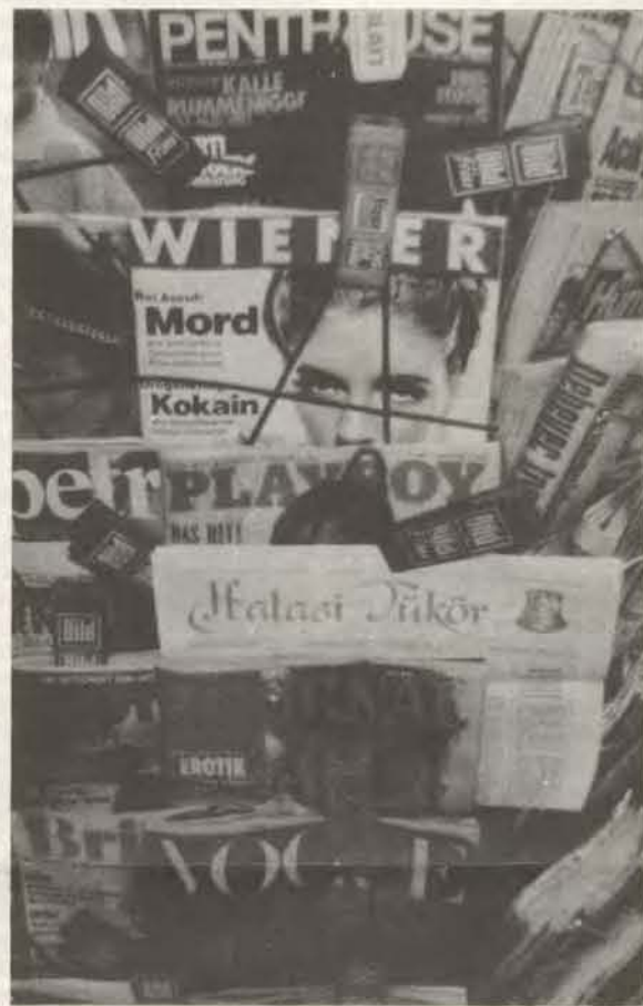
Nyugat-Berlinben készült. Az újságosstandon Playboy még van bőven, viszont Halasi Tükörből a képen látható az utolsó példány.